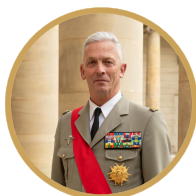
Général d'armée François Lecointre Président de la Fondation Un Avenir Ensemble Grand chancelier de la Légion d'honneur Chancelier de l'ordre national du Mérite