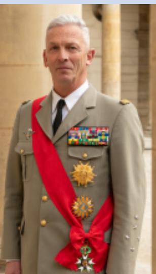
François Lecointre Général d'armée

Votre engagement aujourd'hui peut changer une vie !